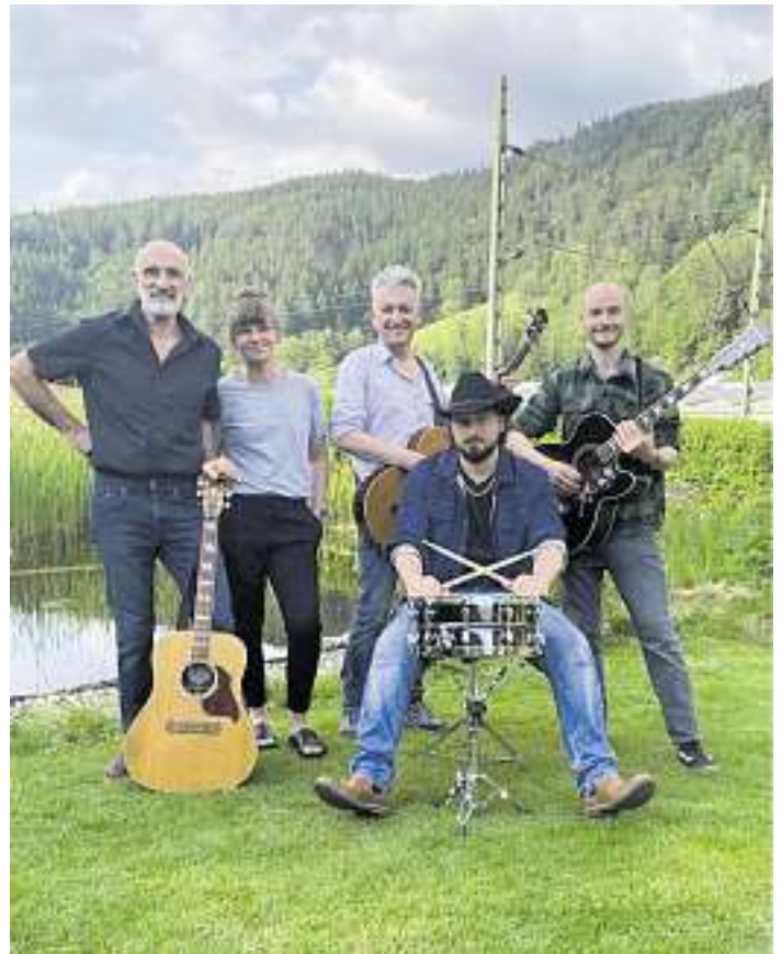
Black Forest Acoustic Company

Auch für Unterhaltung wird gesorgt. Am Samstag Abend findet im Schlosshof um 19.00 Uhr ein gemütlicher Hock statt – musikalisch umrahmt von der legendären Black Forest Acoustic Company.