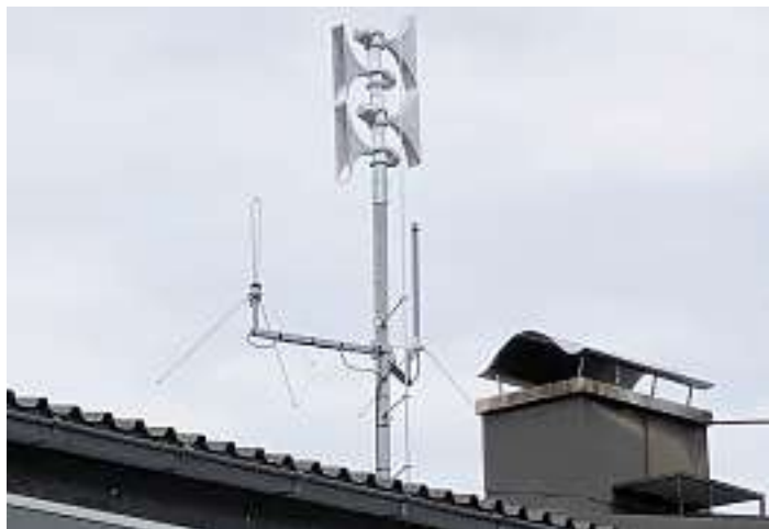
Neue elektronische Sirene auf dem Schulhaus Halbmeil .

Um die Warnung der Bevölkerung in Deutschland zu stärken, stellte die Bundesrepublik Deutschland im Rahmen des Konjunktur- und Krisenbewältigungspaketes 2020 bis 2022 Mittel für die Förderung der Sireneninfrastruktur und die Einbindung in das Modulare Warnsystem bereit. Die Stadt Wolfach hat aufgrund ihres Förderantrages eine Festbetragsförderung für die Errichtung von 9 elektronischen Sirenen erhalten. Die Sirenen werden zurzeit an den vorgesehenen Standorten errichtet.