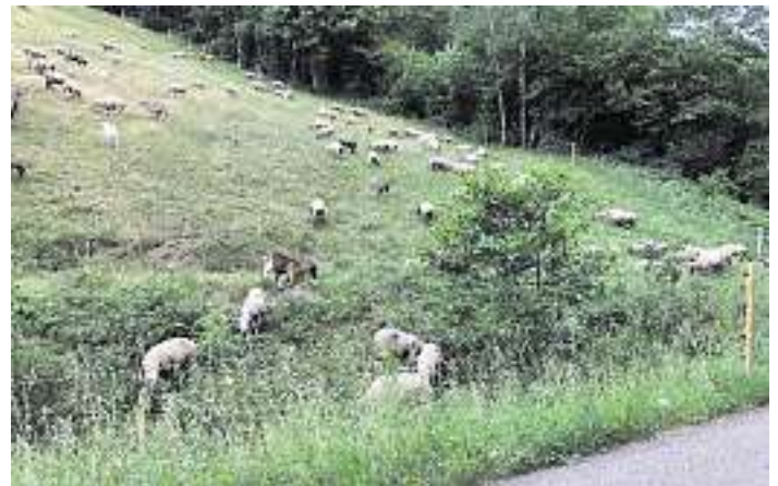
Der neu gebaute Zaun in Wittichen.

Ein großer Dank geht an den Schäfer und die Dorfgemeinschaft Wittichen, ohne die ein solches Projekt nicht umsetzbar gewesen wäre! Nun wurden die Weichen für eine nachhaltige und zukunftsfähige Landschaftspflege in Wittichen gestellt.