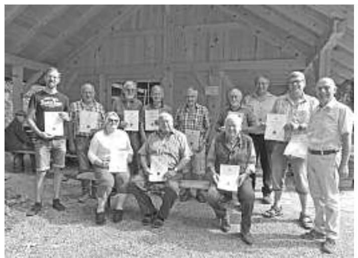
die Grundschüler aus Schramberg-Sulgen und die geehrten Preisträger aus den Reihen der Wolftal-Imker beim neuen Lehrbienenstand