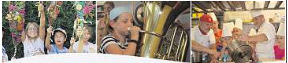
Sommerferienprogramm Wolfach / Oberwolfach

Die Sommerferien sind da und ab morgen startet das diesjährige Sommerferienprogramm.