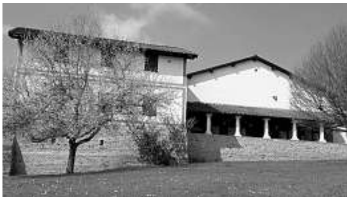
Villa rustica als eines der Wanderziele bei der Gäuwanderung am 8. August.

punkt. Unterwegs bieten sich schöne Ausblicke auf den Albtrauf mit der Burg Hohenzollern. Trotz der Möglichkeit der Einkehr ist es empfehlenswert, einen kleinen Proviant im Rucksack mitzunehmen. Zum Zeitpunkt dieser Mitteilung galten im Kreis Hechingen dieselben Corona Bestimmungen wie bei uns. Eintrittspreis Museum 6 Euro. Gehzeit: 5 Stunden, Länge: 18 km, im Auf- und Abstieg je 300 Meter. Gesamtwanderzeit: 8 Stunden. Wie immer sind auch Nichtmitglieder willkommen. Treffpunkt zur Abfahrt in Fahrgemeinschaften ist um 7.30 Uhr an der Wolfstalschule. Wanderführer ist Albert Schrempp.