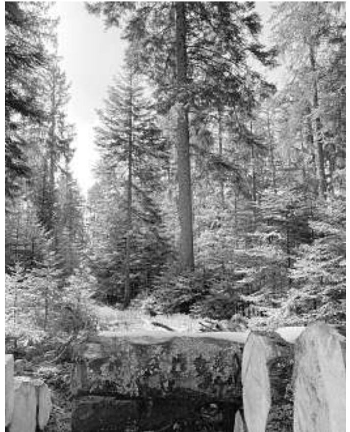
Strukturreiche Wälder, Holznutzung und Klimawandel gehören aus Sicht des Kreisforstamtes zusammen

Bei allen Anliegen rund um den Wald ist das Kreisforstamt telefonisch unter 07441 920-3001 oder per E-Mail unter forst@kreis-fds.de zu erreichen. Die Kontaktdaten zu den Revierleitungen sind auf der Homepage des Landrastamtes www.landkreis-freudenstadt.de zu finden.